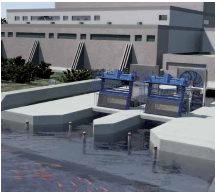
Prise d'eau à deux canaux avec système de répulsion des poissons Geiger® et système automatique de renvoi des poissons Geiger®