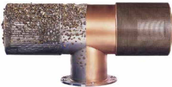
Prise d'eau passive Johnson Screens® (moitié acier inoxydable (côté gauche), moitié en Z-alloy Z (CuNi) (côté droit))

Au fil du temps, divers débris vont s'amasser sur la surface filtrante de la prise d'eau et un nettoyage périodique sera nécessaire afin de conserver un bon fonctionnement de celle-ci. Notre système Hydroburst™ offre un moyen de nettoyage efficace et régulier sans avoir recours à des plongeurs pour nettoyer les prises d'eau. Ce système est conçu pour fournir un volume important d'air comprimé en quelques secondes, procédé qui a fait ses preuves dans tous les types d'application et dans toutes les conditions. Ces volumes d'air sont éjectés du fond de la prise d'eau; et alors qu'ils s'élèvent et s'étendent, ils emportent avec eux les débris présents à la surface de la prise d'eau, nettoyant cette dernière pour un fonctionnement optimal. Nos ingénieurs évaluent la taille de la prise d'eau, sa profondeur ainsi que sa distance de l'Hydroburst™ afin de fournir la quantité d'air adaptée. Les systèmes peuvent être aussi simples qu'une vanne à actionnement manuel, une minuterie programmable ou un automate programmable qui communique avec un système central de contrôle des données (SCADA) pour pilotage.