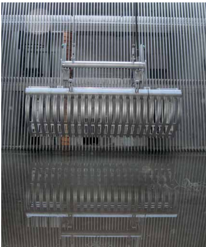
Dégrilleur à grappin suspendu Geiger®