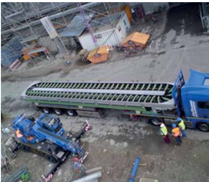
Centrale électrique GKM 9, Mannheim, Allemagne