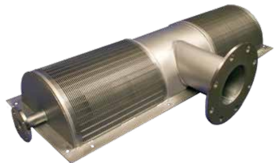
Demi-prise d'eau passive Johnson Screens®