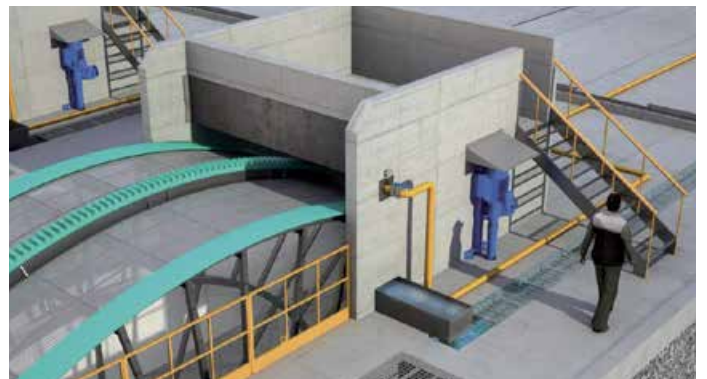
Geiger® tamis grande capacité