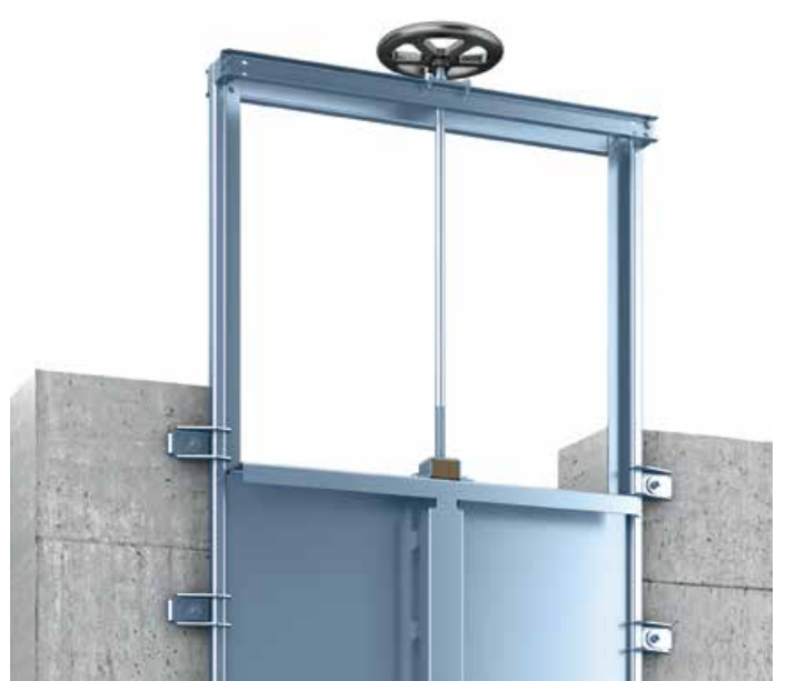
Vannes guillotines Passavant®