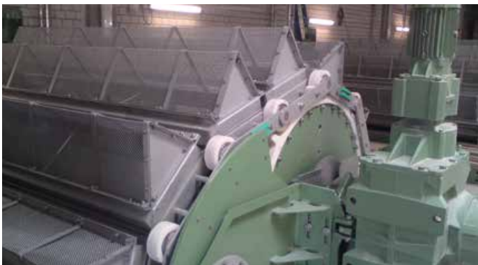
Filtre à chaînes à flux central Geiger®