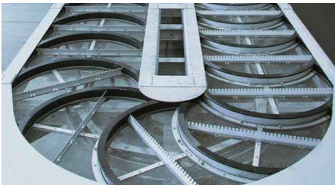
Dégrilleur MultiDisc® Geiger