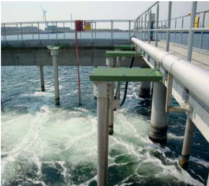
Système de répulsion des poissons Geiger®