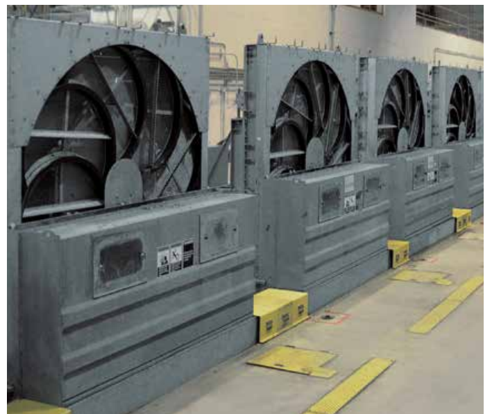
Centrale nucléaire DC Cook, États-Unis