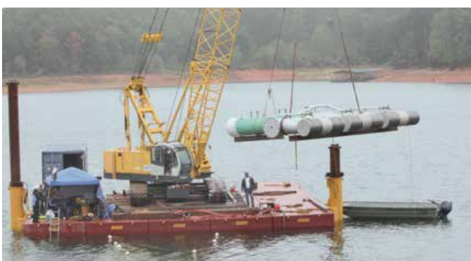
Prise d'eau passive Johnson Screens®