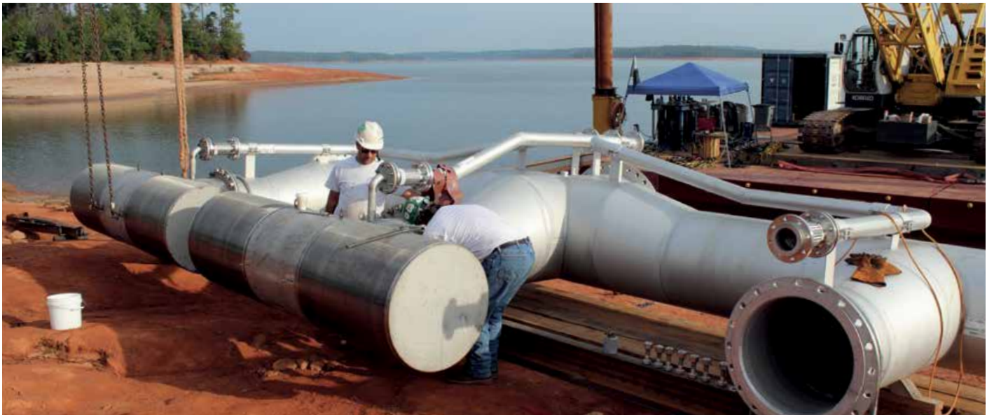
Installation de prise d'eau passive Johnson Screens® : usine d'eau potable, Caroline du Nord, États-Unis