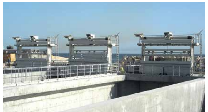
Dégrilleur à godet Geiger®