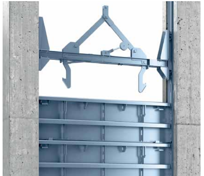
Batardeau Geiger® avec équipement de levage