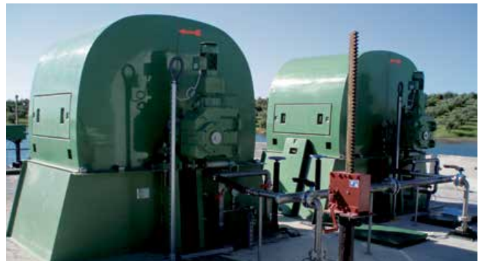
Filtre à chaînes Geiger®