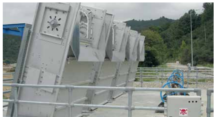
Dégrilleur à chaînes «haute capacité» Geiger®