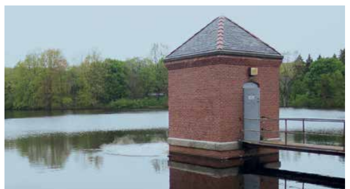
Hydroburst™ en fonctionnement